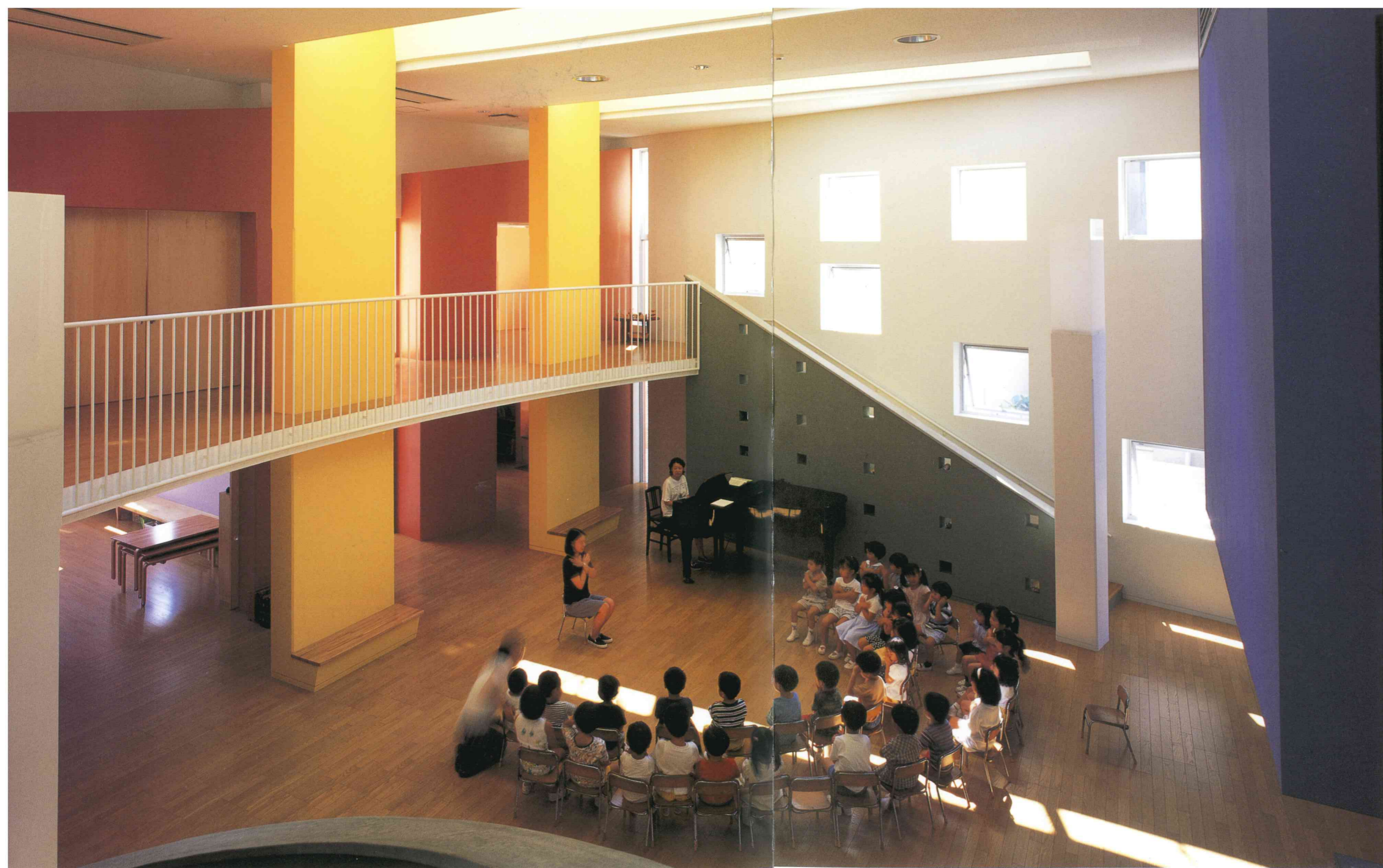
1階のヴォリューム=黄色。階段のオブジェ=緑。多目的ホール空間に詰め込まれたクラスルーム=褐色系オレンジ。階段の照明ボール=白。個性的色彩をもったさまざまな空間エレメントの構成