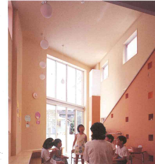
クラスルーム3=さくら貝色。自分たちの小さな家のように