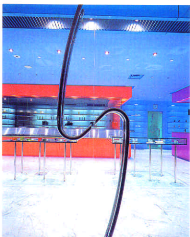
ショーウィンドーを通して見る

SHU UEMURA BEAUTY BOUTIQUE, Fukuoka Designer c.r.c.