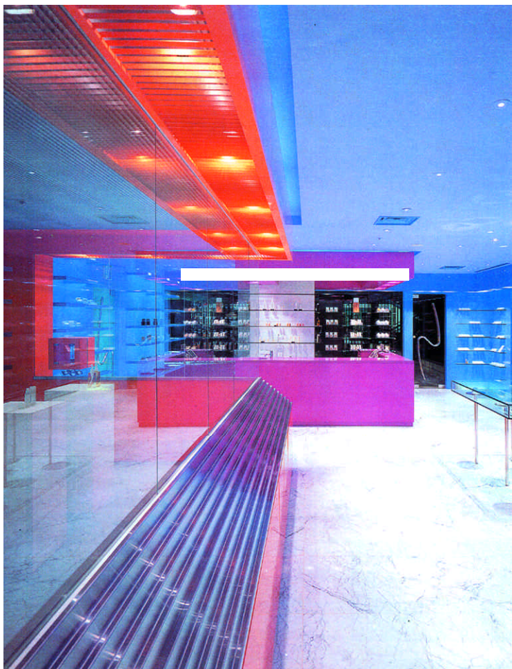
アトリエファクトリー前より受付カウンターを見る

グラスボックス イングラスボックス ガラスの箱の中にガラスの箱がある。 透明な化粧品の箱をこの透明な箱の空間に置く。 商品棚は透明な箱の空間の中に消却させる。